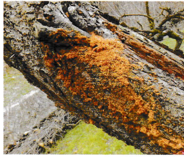
枝の上部から排出したフラス