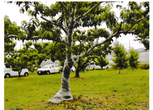
産卵阻止のネット被覆