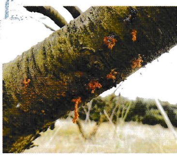
若齢幼虫のフラス