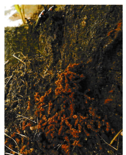
ミンチ状のフラス