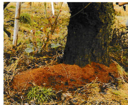
株元に溜まったフラス