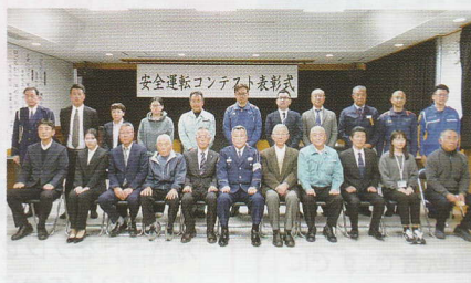
安全運転コンテスト表彰式 有田湯浅支部