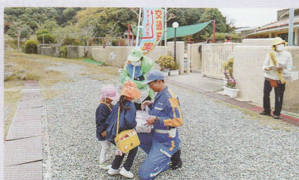
交通ルールを守ってね♪ 白浜支部