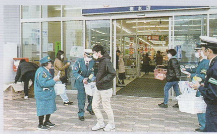
買い物客に交通安全啓発 橋本支部

～ あなたの交通安全協会会費が交通安全ボランティアの活動を支えています ～ 各支部の交通安全活動だより(わかやま冬の交通安全運動などでの啓発活動、交通安全教室の開催等)