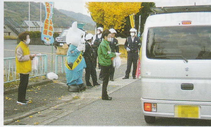
運転者に交通安全啓発 かつらぎ支部