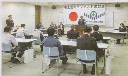
安全運転コンテスト表彰式 海南支部