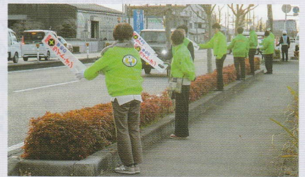
早めのライト点灯をお願いします! 岩出支部