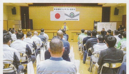
安全運転コンテスト表彰式 和歌山北支部