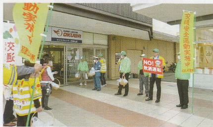
買い物客に交通安全啓発 和歌山東支部