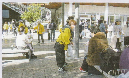
駅前における交通安全啓発 和歌山西支部