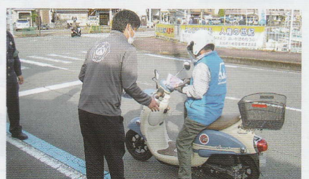
運転者に交通安全啓発 新宮支部