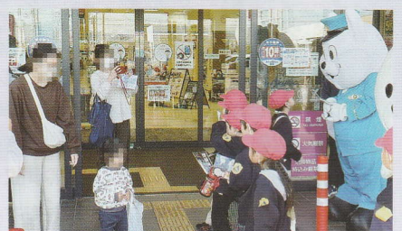
子どもたちと一緒に交通安全啓発 御坊支部