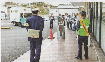
買い物客に交通安全啓発 田辺支部