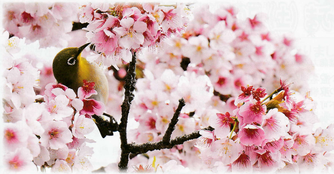
和歌山県の鳥（県鳥）メジロ