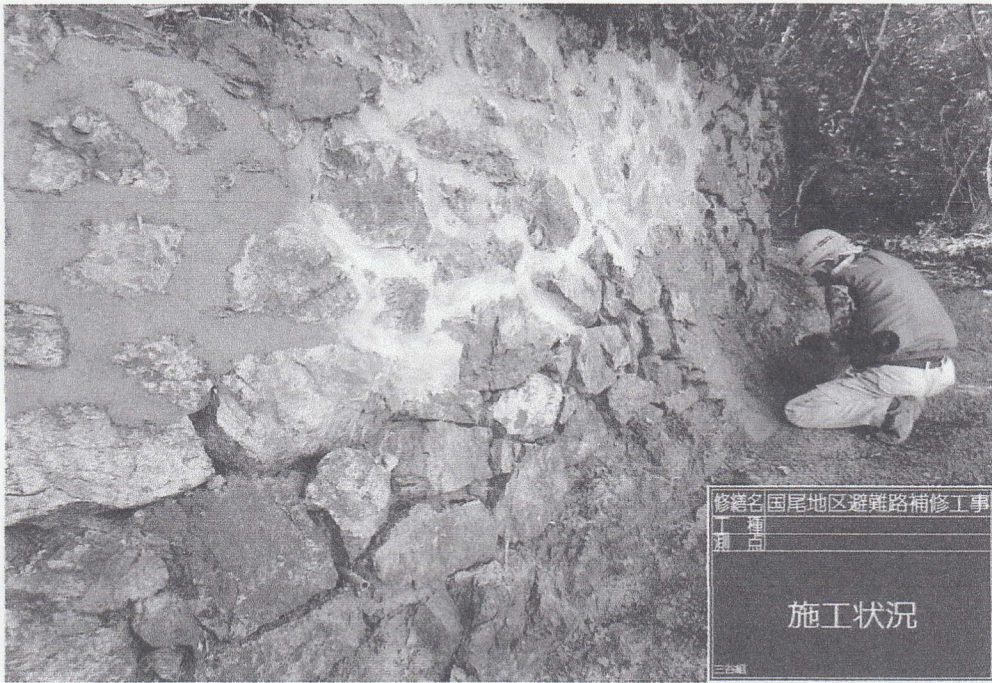
修繕名 国尾地区避難路補修工事 工種 石垣 測点 施工状況 三ヶ瀬