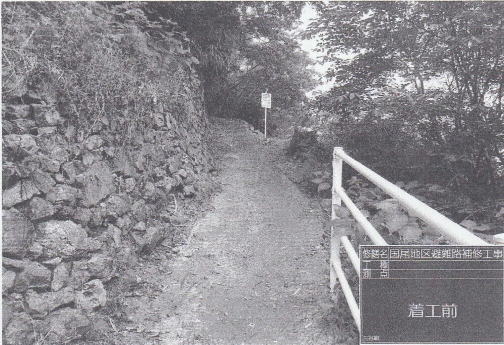
修繕名 国尾地区避難路補修工事 工種 測点 着工前 三谷組