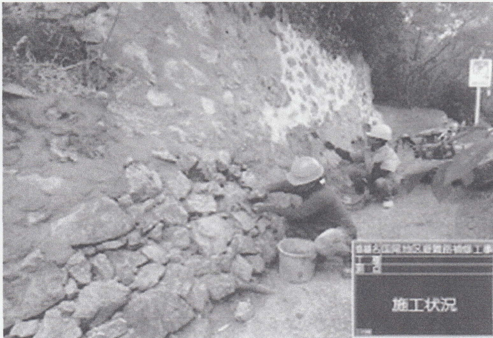
修繕名 国尾地区避難路補修工事 工種 石垣 測点 施工状況