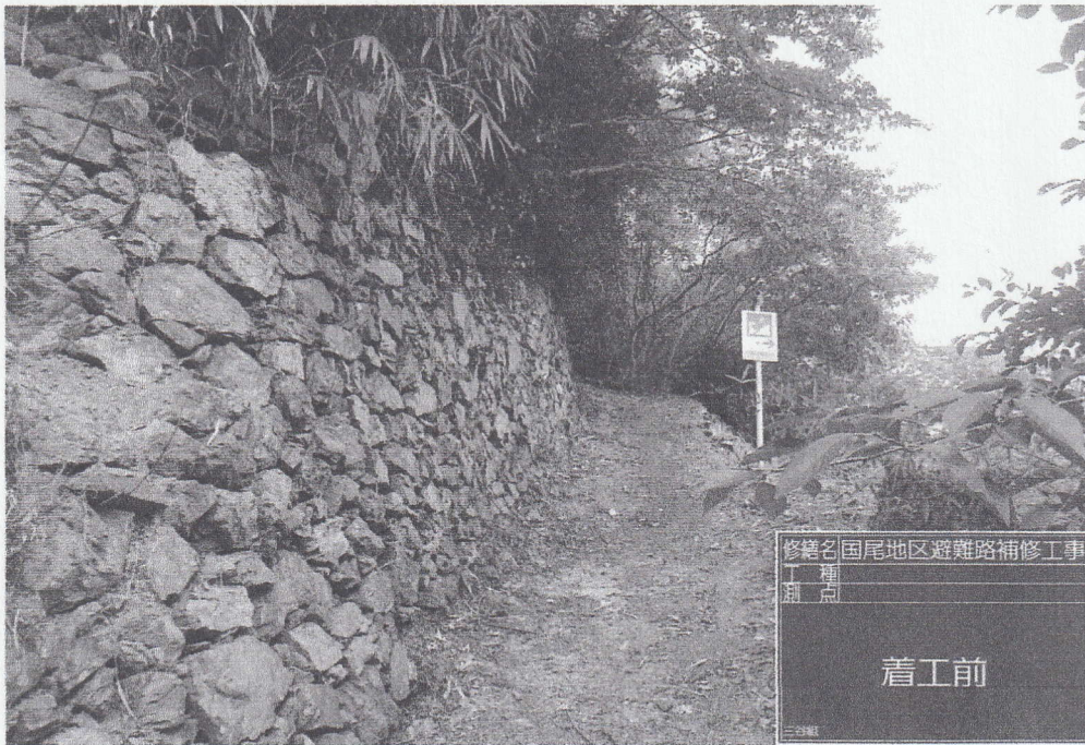
修繕名 国尾地区避難路補修工事 工事種別 測点 着工前 三谷組