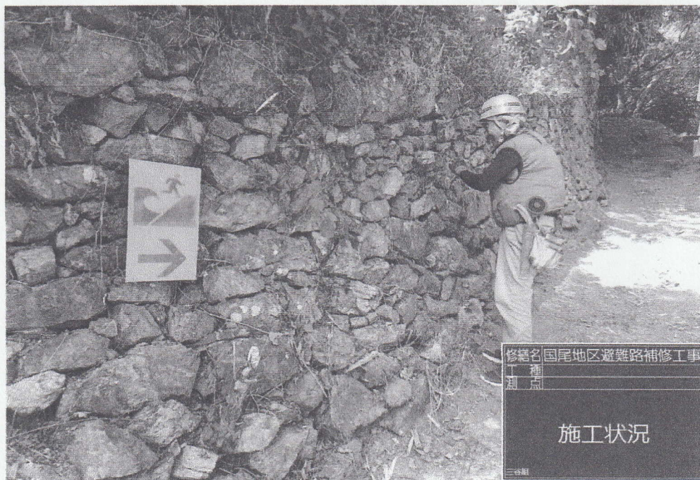
修繕名 国尾地区避難路補修工事 工種 石垣 測点 施工状況 三ヶ瀬