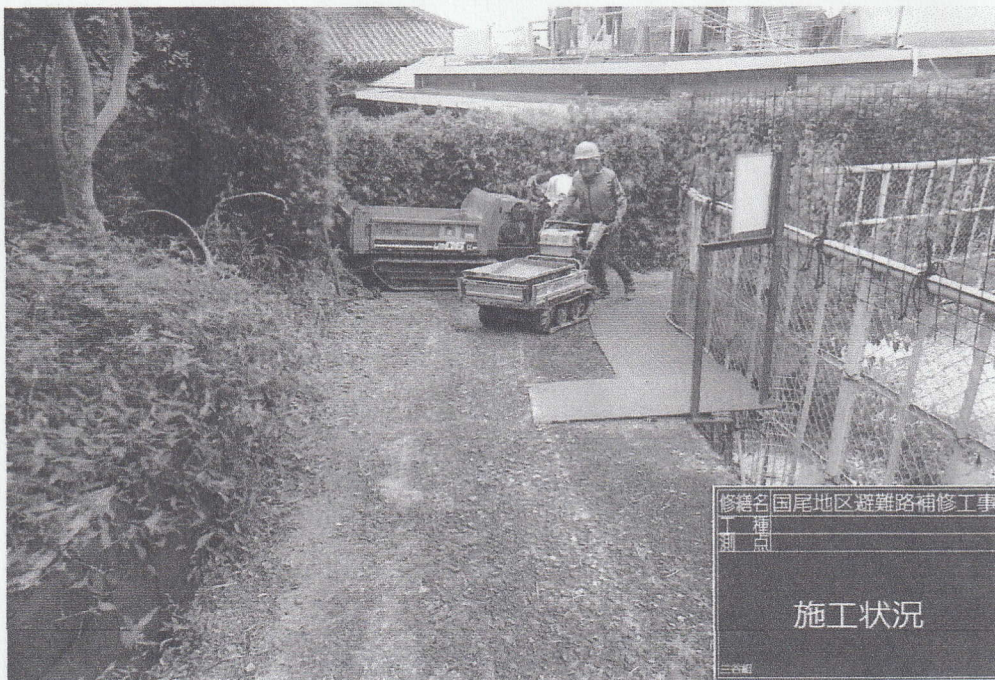
修繕名 国尾地区避難路補修工事 種別 三谷組 施工状況

No. _____ 施工状況 _____ 舗装モルタル打設 _____ _____ _____ _____ _____ _____ _____