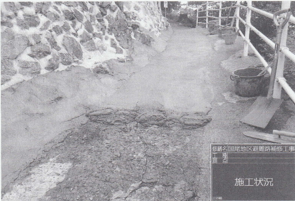
修繕名 国尾地区避難路補修工事 種別 三谷組 施工状況

No. _____ 施工状況 _____ 舗装モルタル打設 _____ _____ _____ _____ _____ _____ _____