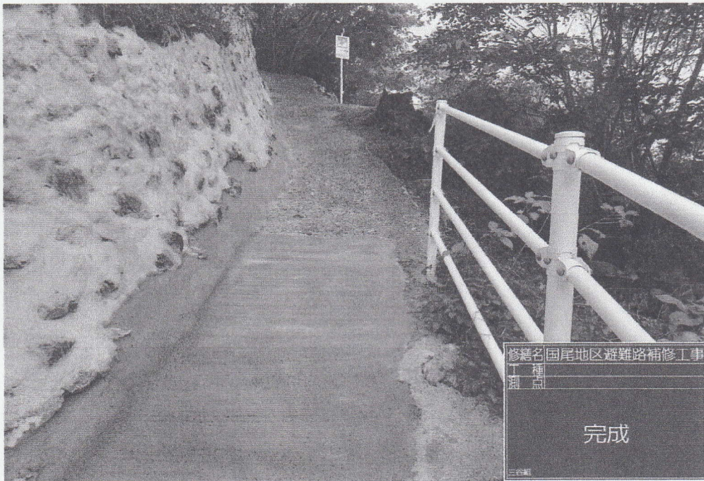
修繕名 国尾地区避難路補修工事 工種 測点 完成 三谷組