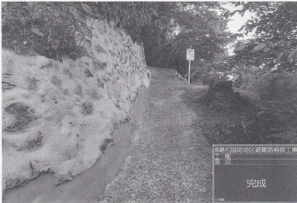
修繕名 国尾地区避難路補修工事 工事種別 測点 完成 三谷組