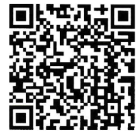
タックスアンサー

よくある税の質問に対する回答をインターネットで 24時間いつでも簡単に調べることができます！