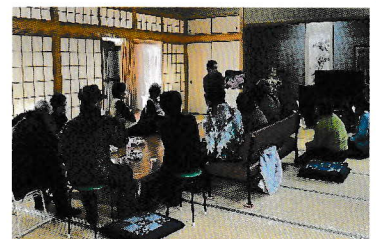
▲ 読み聞かせの様子