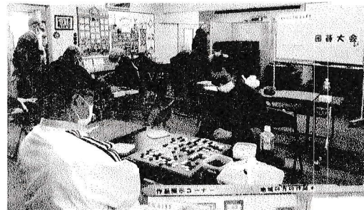
☆囲碁大会☆ 皆さん、一手、 一手に集中！