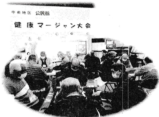
中央地区 公民館 健康 マーシャン大会