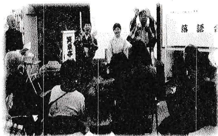
☆落語会☆ 「笑う門には福来る」(´▽`)