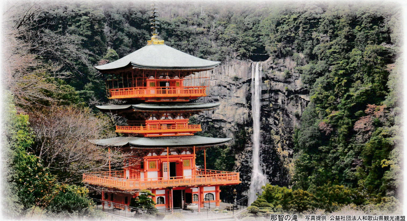
那智の滝