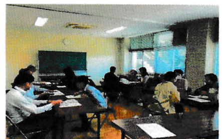
▲ スマホ講座の様子

今後も、地域包括支援センターと協力して、スマホ講座を企画していきます。興味のある方は、お問い合わせください！