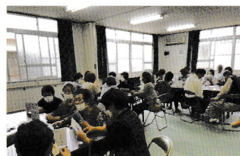
▲ みんなで防災ゲームの様子