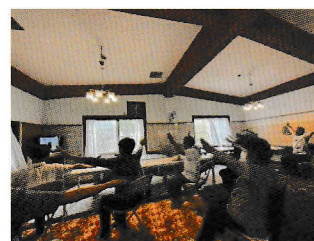
▲ 保田地区初回の様子