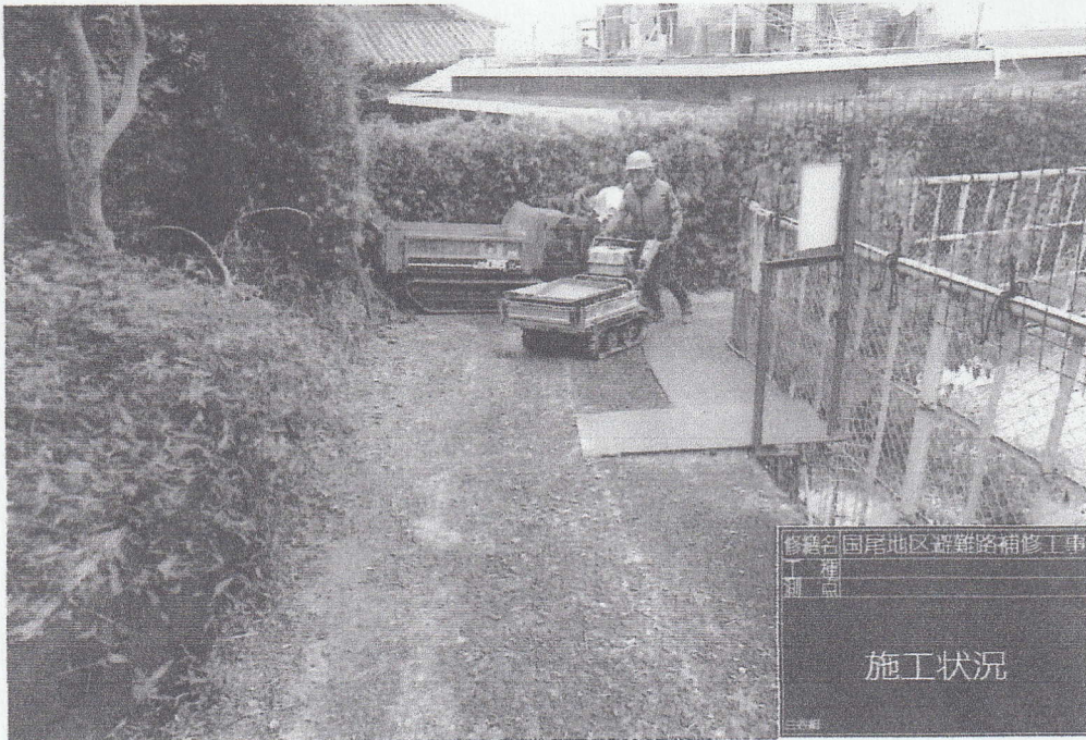
修繕名 国尾地区避難路補修工事 工種 運搬 種別 運搬 施工状況

No. _____ 施工状況 _____ 舗装モルタル打設 _____ _____ _____ _____ _____ _____ _____