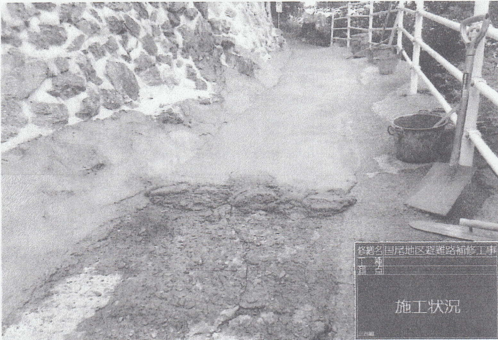
修繕名 国尾地区避難路補修工事 工種 舗装 種別 舗装 施工状況

No. _____ 施工状況 _____ 舗装モルタル打設 _____ _____ _____ _____ _____ _____ _____