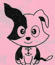
行政相談のマスコット 「キクメン」