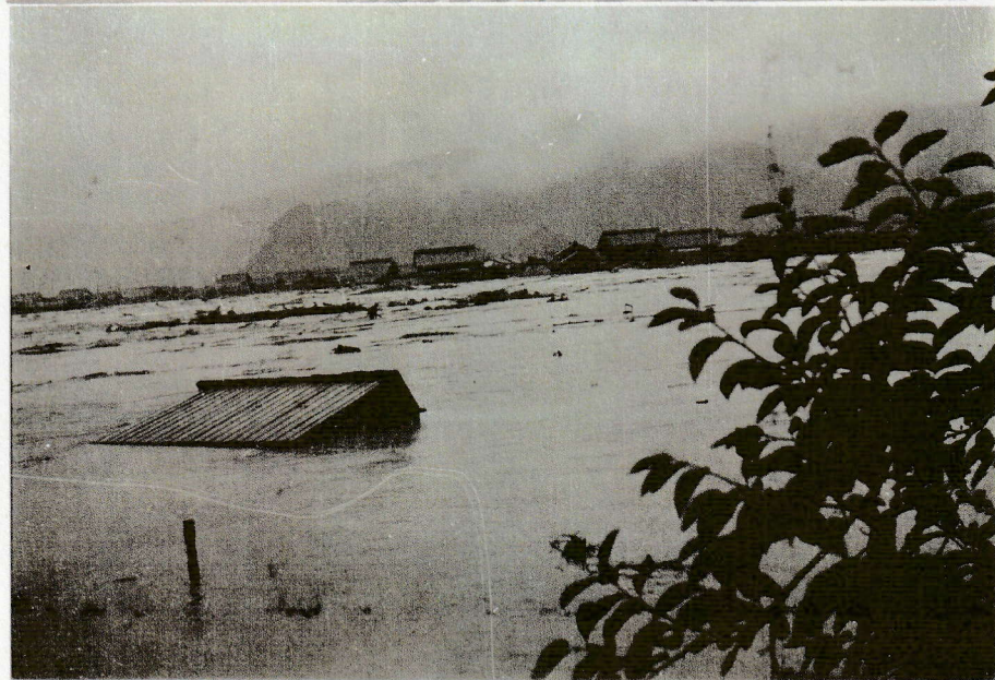
水害写真

講演会 昭和28年7月18日に起こった水害を経験された方に、 当時についてのお話をさせていただきます