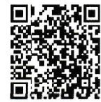
オンライン説明会申込