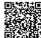
タックスアンサー

よくある税の質問に対する回答をインターネットで 24時間いつでも簡単に 調べることができます！