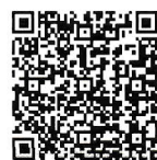
インボイス特設サイト