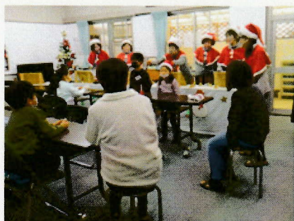
冬のおたのしみ会

市内の公民館では、学校や家庭を含む地域社会全体で子供の健やかな育ちを目指して「ふれあいルーム」を行っています。冬休み中も、各公民館では「ふれあいルーム」が行われました。地域の方々にもご協力いただき、子供たちと一緒に交流を楽しんでいました。楽しい様子の一部を紹介します。