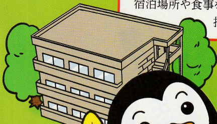
更生ペンギンの ホコちゃん

刑務所等を出た後、帰る場所がない人たちに宿泊場所や食事を提供し、自立に向けた生活指導を行う民間の施設です。