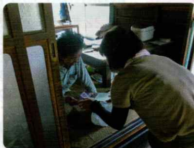
見守りを兼ねたお弁当の配食サービス