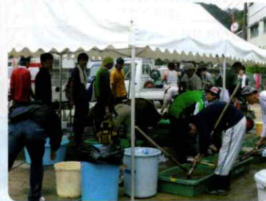
被災地での災害ボランティア活動