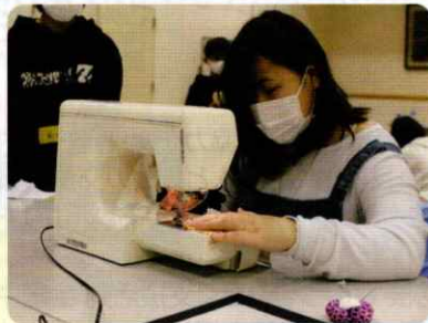
マスク作りボランティア体験