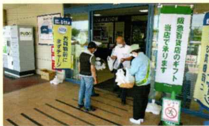
買い物客に交通安全啓発 和歌山東支部