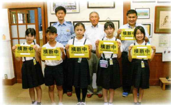
橋本市立高野口小学校