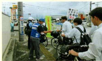
自転車通学生に交通安全を呼びかけ 御坊支部