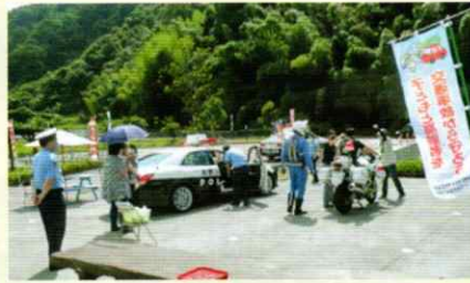
道の駅で交通安全啓発 かつらぎ支部