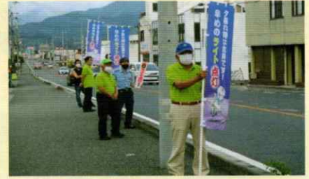
通行車両に交通安全を呼びかけ 岩出支部