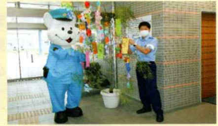
交通安全の願いを込めて♪ 湯浅支部