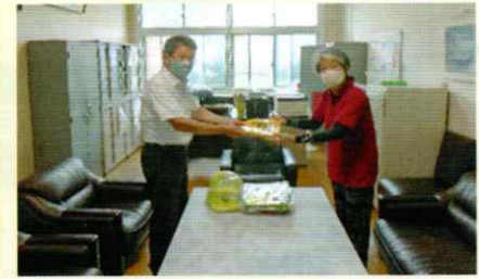
反射ベスト贈呈式 白浜支部