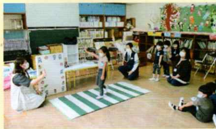
交通ルールを守ろう! 海南支部