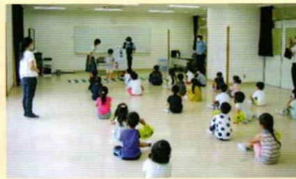
交通ルールを守ってね! 和歌山西支部