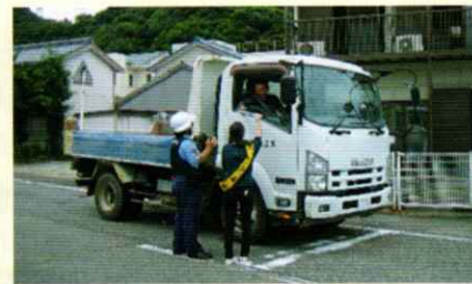
安全運転をお願いします! 新宮支部