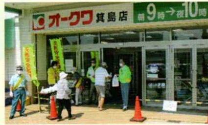
買い物客に交通安全啓発 有田支部