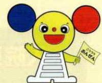
和歌山県交通安全協会 シンボルマスコット ちゅういくん