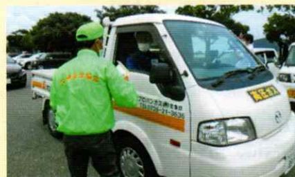
運転者に交通安全啓発 串本支部