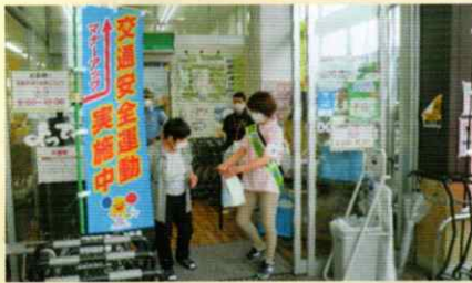
買い物客に交通安全啓発 橋本支部

～ あなたの交通安全協力会費が交通安全ボランティアの活動を支援しています ～ 各支部の交通安全活動だより(2021年わかやま夏の交通安全運動における啓発活動、安全教室の開催など)