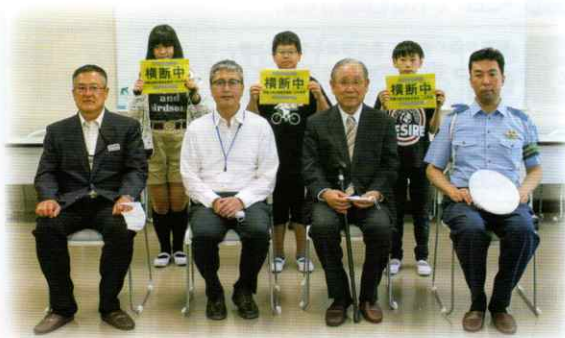
和歌山市立伏虎義務教育学校