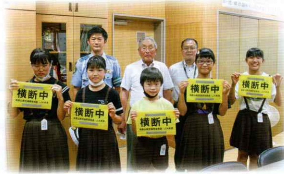
かつらぎ町立妙寺小学校