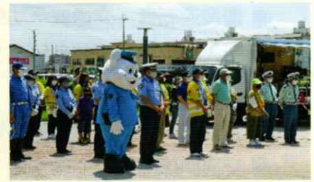
交通安全街頭啓発 和歌山北支部