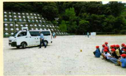
小学校で交通安全教室 田辺支部