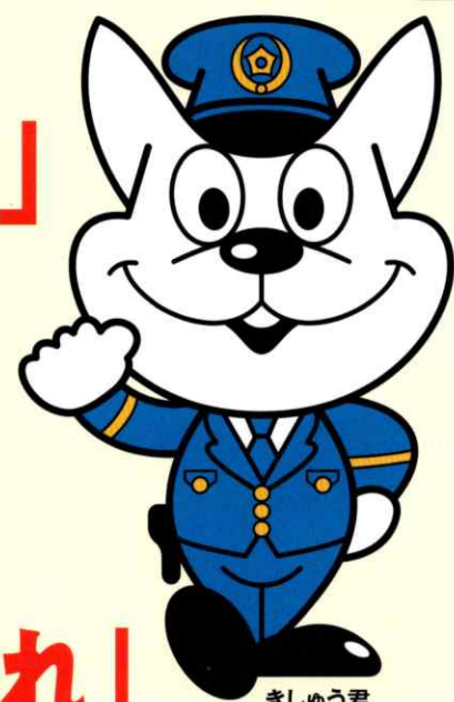
きしゅう君 和歌山県警察マスコットキャラクター