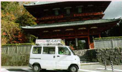
広報車で交通安全啓発 橋本支部

～ あなたの交通安全協会会費が交通安全ボランティアの活動を支援しています ～ 各支部の交通安全活動だより(わかやま冬の交通安全運動などでの啓発活動など)