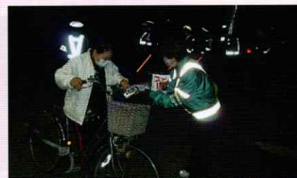
夜間時の交通安全啓発 新宮支部