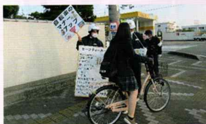
ルールを守って自転車に乗ろう! 御坊支部