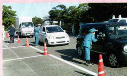
安全運転をお願いします! 串本支部