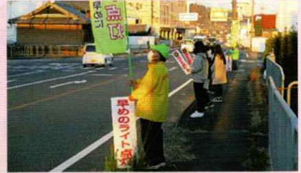
看護学生と交通安全を呼びかけ 岩出支部