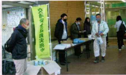
買い物客に啓発物品を配布 かつらぎ支部