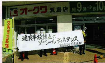
買い物客に交通安全啓発 有田支部