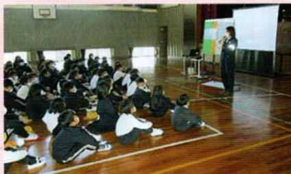
交通ルールを守ってね! 海南支部