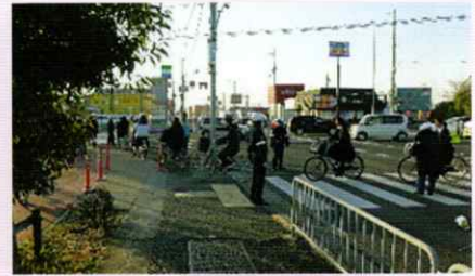
子どもたちの安全を守ろう 和歌山北支部