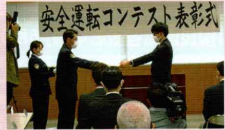
安全運転コンテスト表彰式 湯浅支部