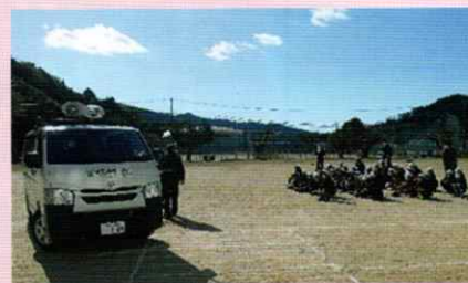
小学校での交通安全教室 田辺支部