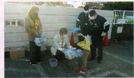
交通ルールを守ろう! 白浜支部