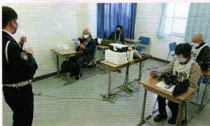
高齢者講習受講者に対する啓発 和歌山東支部