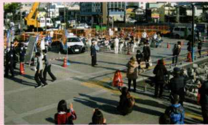
和歌山県警察音楽隊と交通安全啓発 和歌山西支部