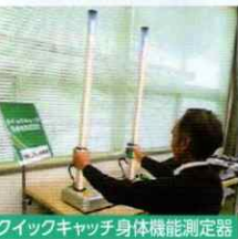
クイックキャッチ身体機能測定器