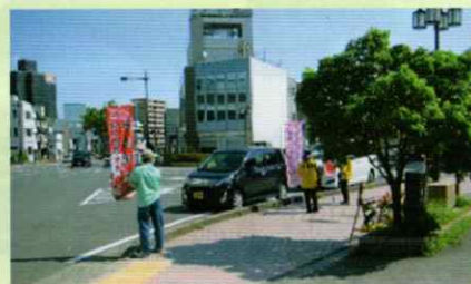
運転者に交通安全を呼びかけ 和歌山西支部