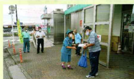
買い物客に交通安全を呼びかけ 串本支部