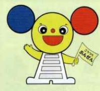
和歌山県交通安全協会 シンボルマスコット ちゅういくん