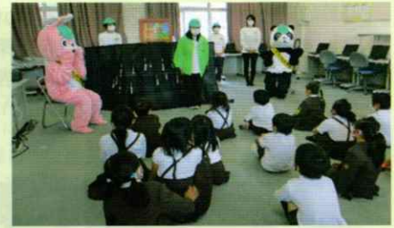
交通ルールを守ってね♪ 岩出支部