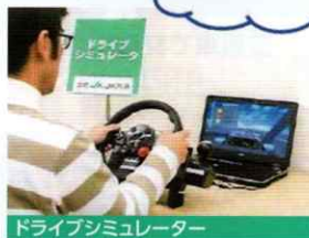
ドライブシミュレーター