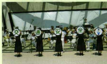
交通安全を呼びかけ! 海南支部