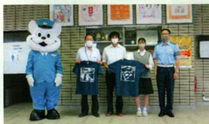
市立高校における啓発Tシャツ贈呈式 和歌山東支部