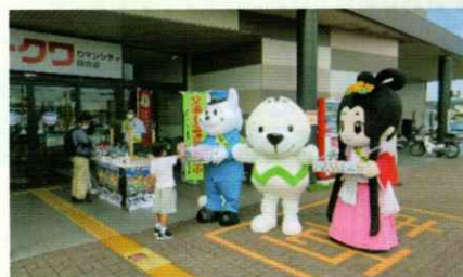
ゆるキャラと交通安全啓発 御坊支部