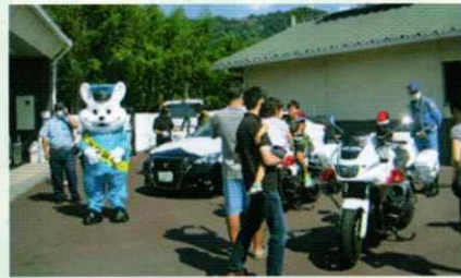
きしゅうくんと交通安全啓発 かつらぎ支部