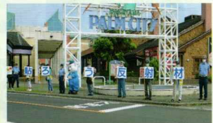
商業施設で交通安全啓発 和歌山北支部