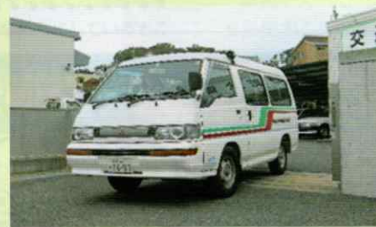
広報車で交通安全啓発 田辺支部