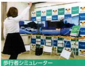
歩行者シミュレーター