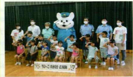
ちびっこ交通安全広報隊 白浜支部