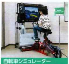
自転車シミュレーター