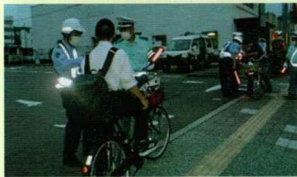
夕暮れ時の交通安全啓発 橋本支部

～ あなたの交通安全協力会費が交通安全ボランティアの活動を支援しています ～ 各支部の交通安全活動だより(秋の全国交通安全運動などでの啓発活動、交通安全教室の開催等)