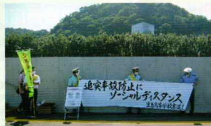
追突事故をなくそう! 有田支部