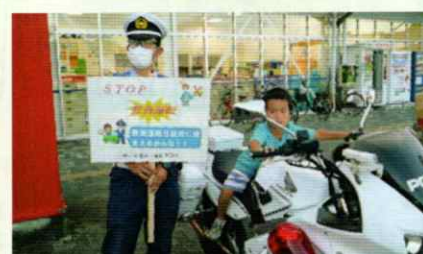
STOP!飲酒運転 新宮支部