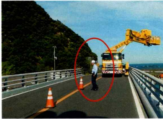
【写真 1】 道路部での交通誘導員の配置状況（例）

※橋桁上歩道部については交通誘導員を配置し歩行者の交通の妨げにならないよう点検を行います。【写真 2】