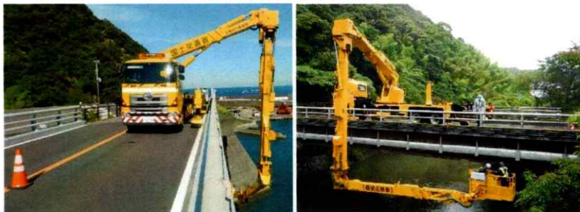
橋梁点検車作業状況（例）