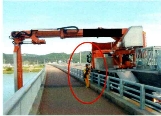
【写真 2】 歩道部での交通誘導員の配置状況（例）