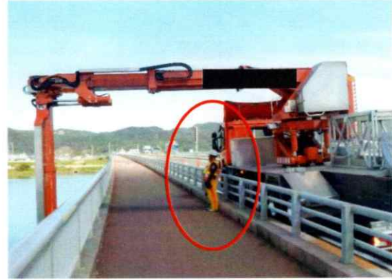
【写真 2】 歩道部での交通誘導員の配置状況（例）