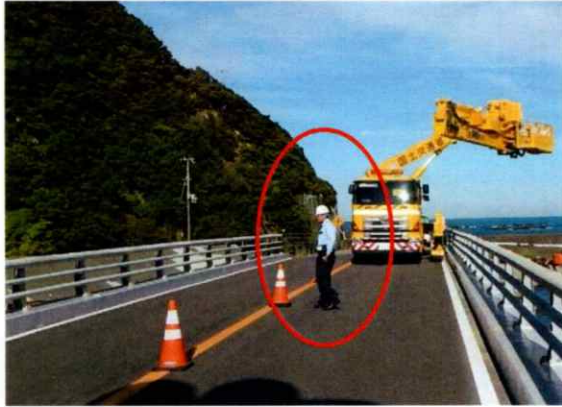
【写真 1】 道路部での交通誘導員の配置状況（例）

※橋桁上歩道部については交通誘導員を配置し歩行者の交通の妨げにならないよう点検を行います。【写真 2】