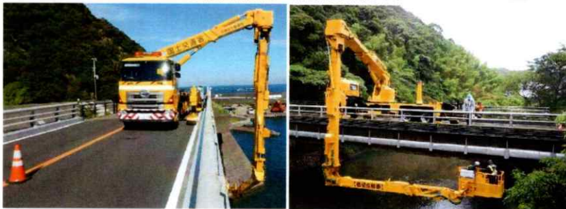
橋梁点検車作業状況（例）