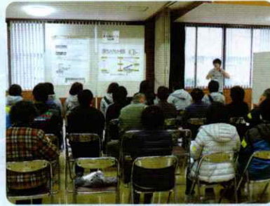
災害ボランティアセンター設置訓練