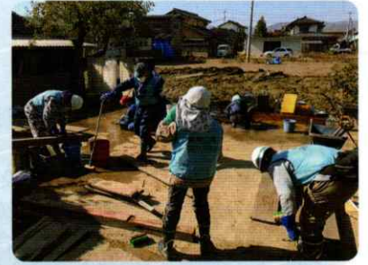
長野 ボランティア活動支援