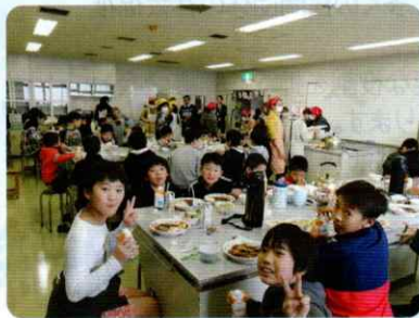
子ども食堂運営支援