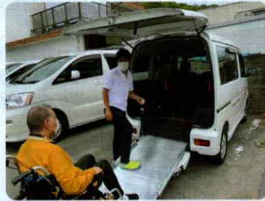
福祉車両購入支援