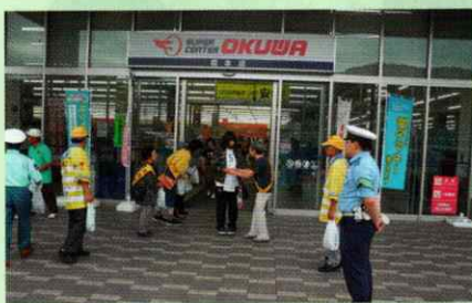
買い物客に交通安全啓発

～免許更新時等に入会していただいたあなたの運転者会費が交通安全活動を支えています～ おもな交通安全活動だより (秋の全国交通安全運動での啓発活動、交通安全教室の開催など)