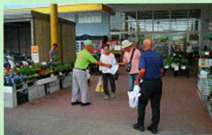
買い物客に交通安全を呼びかけ