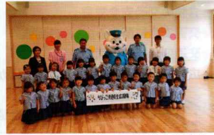
堅田保育園ちびっこ交通安全広報隊