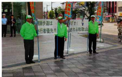
交通安全呼びかけ!