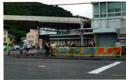
スーパー店頭で交通安全呼びかけ