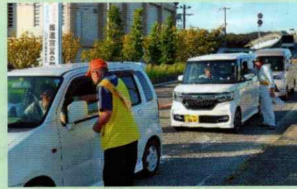
運転手に交通安全啓発