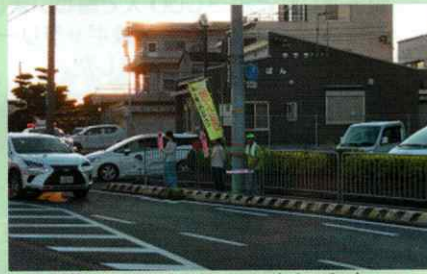
夕暮れ時早めのライト点灯呼びかけ