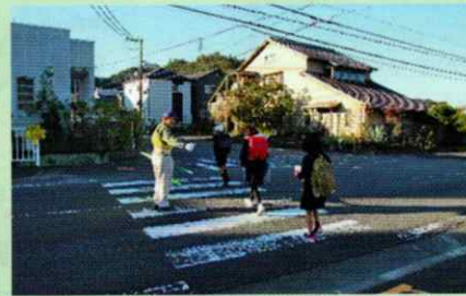
朝の交通安全誘導