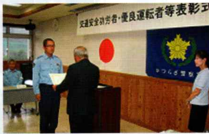
交通安全功労者等表彰式