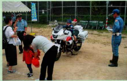
交通安全よろしくね♪