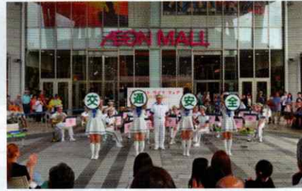
イオンにて買い物客に交通安全呼びかけ