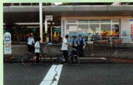
ルールとマナーを守ってくださいね