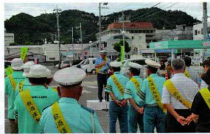
有田交通安全フェスティバル