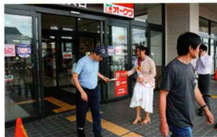
交通安全大使「ソレイユ」と啓発