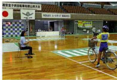
安全走行(横断歩道)