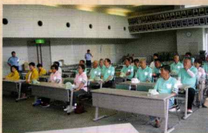
夏の交通安全運動出陣式 和歌山西支部