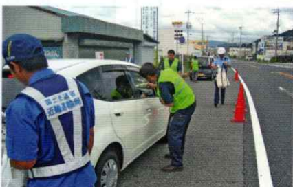
安全運転をお願いします！ 有田支部