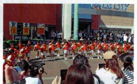
交通安全よろしくね♪ 和歌山北支部