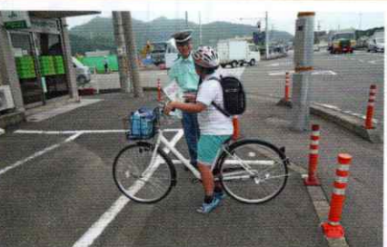
ルールとマナーを守ってね！ 新宮支部