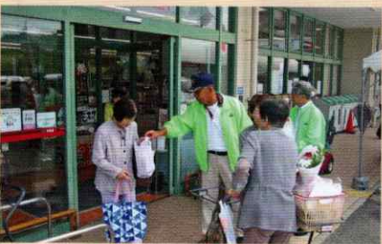
買い物客に交通安全啓発 海南支部