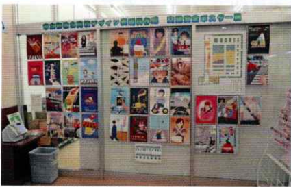
市立和歌山高校交通安全ポスター展 和歌山東支部