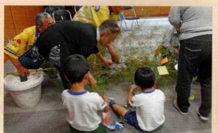
交通安全の願いをこめて 湯浅支部