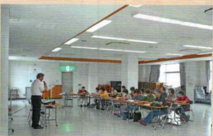
交通安全講話 田辺支部