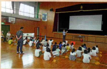
恋野小学校にて交通安全教室 橋本支部

～あなたの交通安全協力会費が交通安全ボランティアの活動を支援しています～ 各支部の主な交通安全活動（2019年わかやま夏の交通安全運動などでの啓発活動、安全教室の開催等）