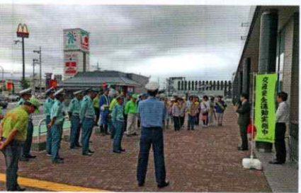
交通安全街頭啓発 御坊支部