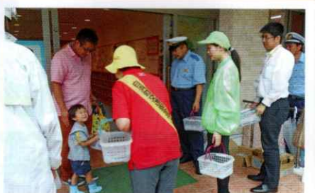
優しく園児らにチャイルドシート啓発 白浜支部