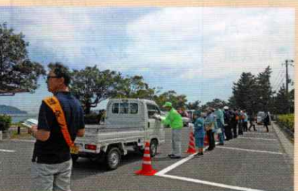
ドライバーに安全運転を呼びかけ 串本支部