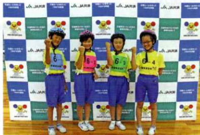
優勝チーム(恋野小学校B)