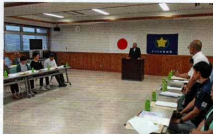
交通安全協会支部総会 かつらぎ支部