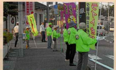
早めのライト点灯を呼びかけ 岩出支部