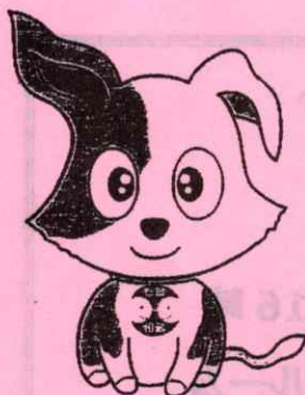
行政相談窓口 マスコットキャラクター 「キクーン」