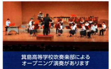
箕島高等学校吹奏楽部による オープニング演奏があります

主 催:有田市・有田市教育委員会・有田市連合自治会・有田市人権尊重委員会 お問い合わせ:有田市市民福祉部市民課人権啓発係 ☎0737-22-3558(直通)