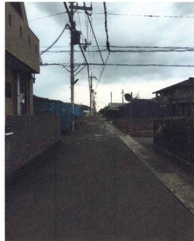
写真1 北方向から見た交差点